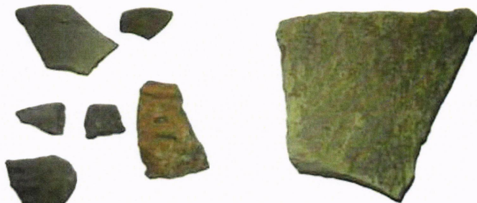
Керамика от обект 5000